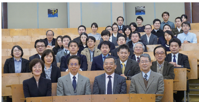
(日本眼科症例検討会終了後集合写真)