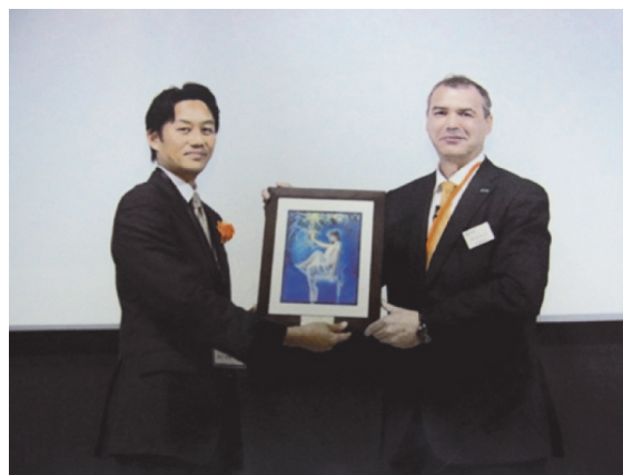
Neuromuscular Meeting で受賞