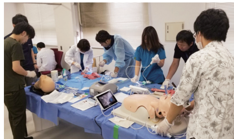
神経ブロックのワークショップを学内外で開催し、好評を得ています