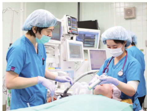
教育に力を注いでおり、手術室で身につけた技術はペインクリニックや集中治療など多方面にいかされます

麻醉だけでなくペインクリニック分野も認定医による指導を行っており、比較的早い学年からトリガーポイントや神経ブロックなど徐々に無理なく技術習得できるように計画しています。緩和ケアに関しては、緩和ケアチームと連携して痛みの治療に当たっているほか、関連の専門病院で学ぶことも可能です。