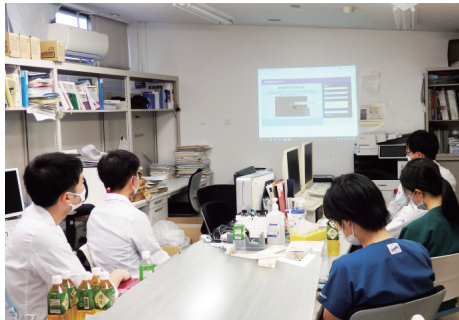
カンファレンス風景