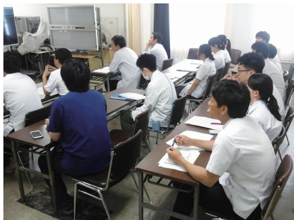
カンファレンス風景写真2