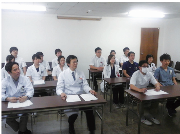
カンファレンス風景写真1

病棟グループ構成は、病棟医長を先頭に、初期臨床研修医及び内科後期研修医、認定医及び指導医（通常2～3名）、4～5名で1グループの医師構成のもと腎臓・高血圧・内分泌疾患患者を受け持ちます。腎臓内科は3グループ、高血圧内分泌内科は1グループで病棟運営を行っています。分野全体の入院患者数／年は300～400症例程度で、週1回の部長回診と症例カンファレンス（写真1、2）を積極的に取り組み、研修医や専門医を目指す若手医師の討論が出来る環境となっています。